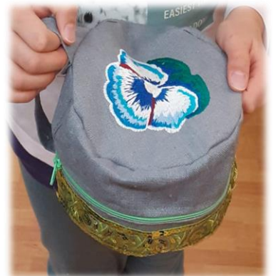
Dein praktisches Nessecaire (Hutschachtel-Form)